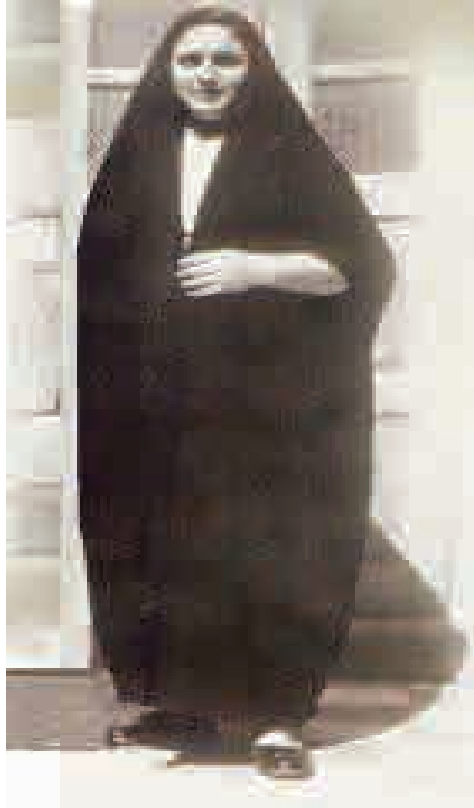
أعلام دير الزور- العباية الديرية

في دير الزور تتمتع النساء بحضور قوي ومؤثر في الحياة اليومية، وهذا الحضور ليس حضورًا تقليديًا، وإنما يدل على استقلالية المرأة في المدينة، فأجيال النساء التي مرت على المدينة كل جيل له طابعه الخاص من الأزياء، بحسب الواقع السياسي والاقتصادي. فترى جيل الجدات (الجابات) كما يعرف الجميع، هو جيل محافظ يغلب عليه طابع التدين البسيط، كُنَّ يرتدين العباءة (العباية الحبر) الجميلة.