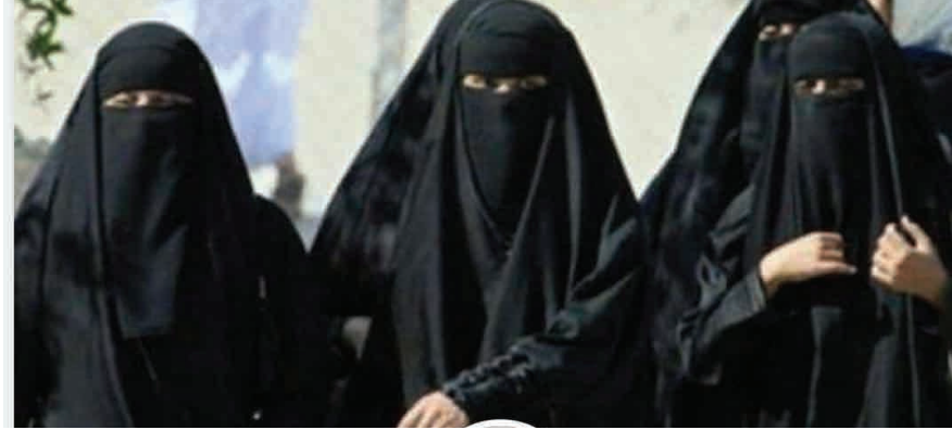
شبكة المرأة السورية، معاناة النساء في دير الزور تحت حكم داعش

تقول (ش.ح) وهي شابة موظفة انتقلت من دير الزور إلى دمشق في 2012: لقد شدد النظام على المحاسبين بعدم صرف أي راتب إلا لصاحبه شخصياً، لذلك يتعين على أبناء دير الزور الحضور بصورة شخصية (لحي الجورة) المحاصر لاستلام رواتبهم، لذلك لبست اللباس الشرعي خوفاً من تنظيم الدولة (داعش)، وكنت وحدي، لم يكن معي محرم، عندها في الباص تبرع شاب، وساعدني، وقال إنه زوجي. ومن بعد تلك الحادثة لم أذهب إلى دير الزور لاستلام راتي، وفصلت من وظيفتي.