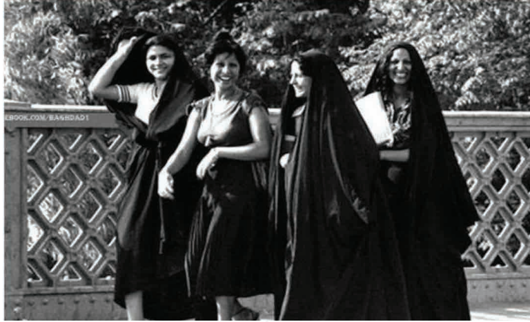
صفحة حوريات الفرات